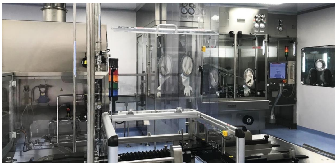
Reparto di liofilizzazione nella sede Patheon di Monza